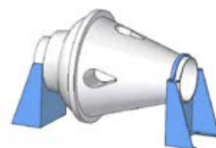
Halterung für horizontale Montage

Das Gehäuse- und Radmaterial kann innerhalb des angegebenen Bereichs gemäß den Anforderungen eines bestimmten Projekts ausgewählt werden und muss in der Ventilatortorspezifikation angegeben werden.