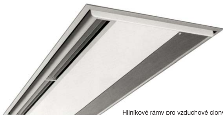
Hliníkové rámy pro vzduchové clony OR-AK