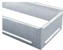
Einbaurahmen für Kaminroste