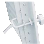
KL – Jalousiesteuerung