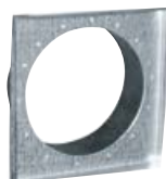
Befestigung mit Hals