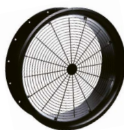
TADF mit Schutzgitter