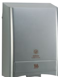
SL-2002 AUTOMATIC SILVER