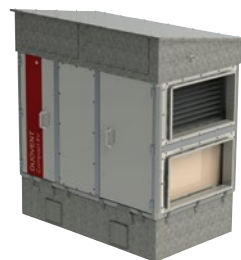
Příklad nástřešního provedení ROOFPACK-B