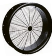
TADF s ochrannou mřížkou