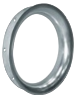
TAD bez ochranné mřížky