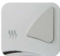
Spouštěcí tlačítko SL-2008