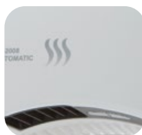
Senzor pohybu SL-2008 AUTOMATIC / AUTOMATIC SILVER