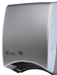
SL-2008 AUTOMATIC SILVER