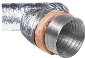
SEMIFLEX SONO, TERMO