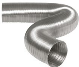
SEMIFLEX STANDARD, PROFI