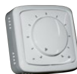
prostorové teplotní čidlo TGBR