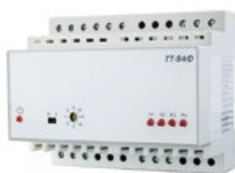
modul TT-S4/D (101x74x85 mm)